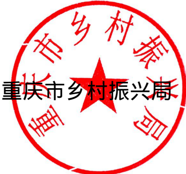
重庆市乡村振兴局