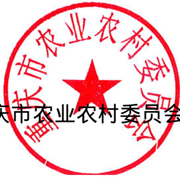
重庆市农业农村委员会