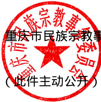
重庆市民族宗教事务委员会